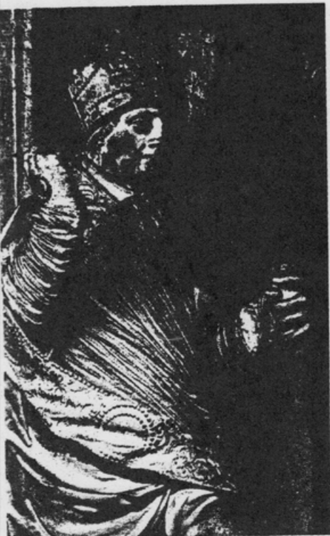
STATUE DU PORCHE SUD VERS 1220